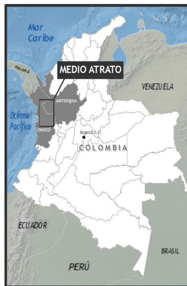
Mapa de demarcación de la Región del Medio Atrato 3 .

El conjunto del estudio que construí, se sustentó en un análisis crítico de las vivencias y experiencias acumuladas como investigador desde el año 2008 hasta el 2016, siendo ese periodo, el tiempo que duró la realización de trabajo de campo en la región del Medio Atrato representada en el siguiente mapa.